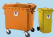
PUBELE ȘI CONTAINERE