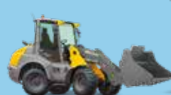
ÎNCĂRCĂTOARE CU BRAȚ PIVOTANT