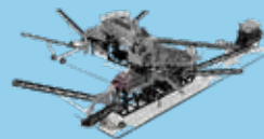
STAȚII DE SORTARE CU SPĂLARE