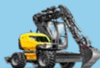
MULTIFUNCȚIONALE PE PNEURI