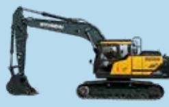
EXCAVATOARE PE ȘENILE