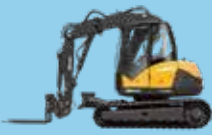
MULTIFUNCȚIONALE PE ȘENILE