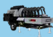
RECUPERATOARE DE NISIP