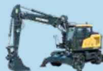
EXCAVATOARE PE PNEURI