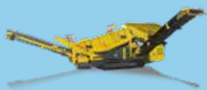
STAȚII DE SORTARE MOBILE