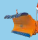
LAME ȘI FREZE DE ZĂPADĂ