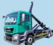
CAMIOANE CU CÂRLIG